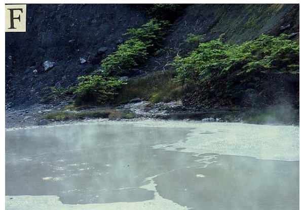
図1 後志管内の調査湖沼の外観