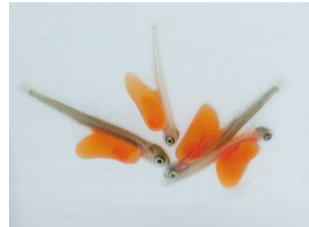
●「サケの赤ちゃん」 展示中～2月上旬まで