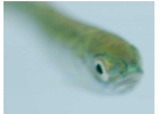
●「サケ稚魚の群泳」 1月中旬～5月5日まで