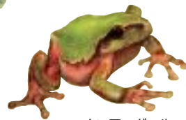
ニホンアマガエル